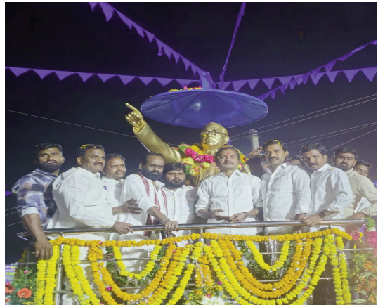
ధర్మ సమాజ్ పార్టీ