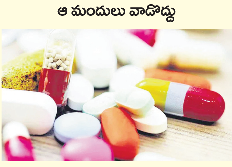
ఆ మందులు వాడొద్దు

వండకూడదు. వాటిని ఇనుముతో కలిపినప్పుడు రుచి పూర్తిగా మారుతుంది. అంతేకాకుండా, పాల ఉత్పత్తులను ఇనుప పాత్రలలో వండినప్పుడు, వాటి రంగు చెడిపోతుంది. చేపలు చాలా మృదువుగా ఉంటాయి కాబట్టి, ఇనుప పాత్రలలో వండినప్పుడు అవి విరిగిపోతాయి. అలాగే, ఇనుప పాత్రలను వేడి చేసినప్పుడు, చేపలలోని ప్రోటీన్లు, వాటి రుచి, ఆక్రమి మారిపోతుంది.ఇనుప పాత్రలలో వంట చేసేటప్పుడు ఈ విషయాలను గుర్తుంచుకోండి.ఇనుప పాత్రలో వండిన ఆహారాన్ని వెంటనే మరొక గాజు లేదా ఎనామెల్ పాత్రలో చేయండి. ఇనుప పాత్రలను కడగడానికి తేలికపాటి డిట్లెంట్ ఉపయోగించండి. ఇనుప పాత్రలను కడిగిన వెంటనే ఒక గుడ్డతో తుడవండి. ఇనుప పాత్రలను ఉపయోగించడం ఆరోగ్యానికి చాలా మేలు చేస్తుంది. ఇనుప లోపం ఉన్నవారికి అది మంచి ఎంపిక. ఇనుప పాత్రలలో వండిన ఆహారం శరీరానికి అవసరమైన ఇనుమును అందిస్తుంది. హిమోగ్లోబిన్ స్థాయిలను పెంచుతుంది. అయితే, అన్ని రకాల ఆహారాన్ని ఇనుప పాత్రలలో వండకూడదు. కొన్ని అంశాలు ఇనుముతో చర్మ జరిపి ఆహారం రుచి, పోషకాలను హాని ప్రయాసం ఉంది.(నోట్ : ఇంటర్నెట్లో మరియూ పుస్తకాల ఆధారంగా సేకరించిన సమాచారం ఆధారంగా ఈ వివరాలు మీకు అందించటం జరిగింది. ఇందులోని అంశాలు కేవలం అవగాహన కోసం మాత్రమే. తదుపరి జరిగే ఎలాంటి పరిణామాలకు సత్యమేవ జయతే బాధ్యత వహించదు.)