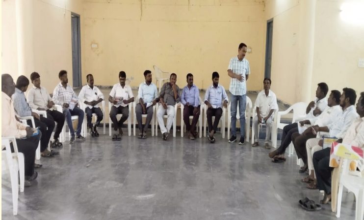
సత్యమేవ జయతే - నాగర్ కర్నూల్ నాగర్ కర్నూల్ : నాగర్ కర్నూల్ జిల్లా కేంద్రంలో బాబు జగ్జీవన్ రామ్ భవన్లో స్వేచ్ఛోస్ నాయకులు ముఖ్య సమావేశం నిర్వహించారు... ఈ కార్యక్రమంలో ముఖ్య అతిథిగా హాజరైన రాష్ట్ర సీనియర్ నాయకులు ఆరకంటి మల్లయ్య మాట్లాడుతూ ఈరోజు మనమందరం అనుభవిస్తున్న హక్కులు,వసతులు మరియు అధికారులన్నీ మహనీయుల త్యాగమని కొనియాడారు.