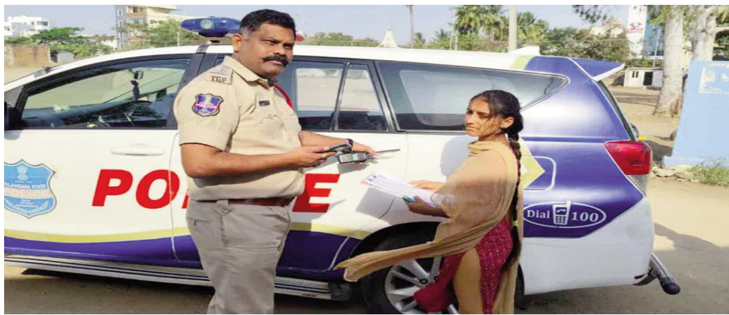
సెంటర్లో ప్రవేశించడం ఉత్తమమని అధికారులు సూచించారు. అలస్యంగా వచ్చే వారిని అంటే 9:05 గంటల తర్వాత వచ్చే వారిని అస్సలు అనుమతించరు.

సత్యమేవ జయతే - జనగామ జనగామ : పోలీసులు అందరు క్రొవ్వుగా ఉండరని, వారిలో సైతం మానవత్వం ఉంటుందని సంఘటనలు పలు మార్లు రుజువు అవుతుంటాయి.