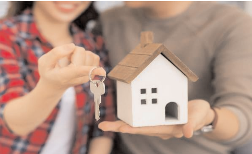
తెలిసింది. రూ. 45 లక్షల లోపున్న సరసమైన గృహాలకు మాత్రం తక్కువ ప్రాధాన్యత ఉన్నట్లు స్పష్టం చేసింది.

మెంట్ అనగానే బంగారంపై అని అనుకుంటే పొరపాటే అవుతుంది. కాబట్టి సర్వే నివేదికలు మాత్రం అందుకు భిన్నంగా ఉన్నాయి. స్వర్ణం కనీసం టాప్ రెండు స్థానాల్లోనూ లేకపోవడం ఆశ్చర్యపదాల్సిన విషయమే. పడిపోయిన బంగారం స్థానం: రియల్ ఎస్టేట్ కనస్ట్రక్షన్ల సంస్థ అనరాక్ ఒక సర్వే నిర్వహించింది. మొత్తం 5 వేల 5 వందల మంది ఇందులో పాల్గొన్నారు.. వారిలో 50 శాతం మహిళలే. పెట్టుబడుల విషయపై వారిని ప్రశ్నించగా.. 65 శాతం మంది రియల్ ఎస్టేట్లో, 20 శాతం స్టాక్స్ లో ఇన్వెస్ట్ చేయడానికి ఆసక్తి చూపిస్తున్నట్లు వెల్లడైంది. బంగారంపై ఆసక్తి చూపే వారు కేవలం 8 శాతం మాత్రమే ఉన్నట్లు తెలిసింది. మిగిలిన 7 శాతం మంది ఫిక్స్ డివిడెండ్ల వైపు మొగ్గుచూపిస్తున్నట్లు సర్వే ఫేర్లొంది. దాదాపు అరకోటిపైనే ఆసక్తి: రూ.45 లక్షలకు పైగా ఉన్న ఇళ్లపై 83 శాతం మంది మహిళలు ఆసక్తి చూపిస్తున్నట్లు మరో పరిశోధనలో తేలిందని అనరాక్ వెల్లడించింది. రూ.45-90 లక్షల శ్రేణిని 36 శాతం మంది మహిళలు స్వీట్ స్పాట్స్ గా చూస్తున్నారని, 27 శాతం రూ.90 లక్షల నుంచి రూ.1.5 కోట్ల వరకు ఉన్న ప్రీమియం గృహాలను ఇష్టపడతున్నారని. అయితే దాదాపు 20 శాతం మంది రూ.1.5 కోట్ల కంటే ఎక్కువ ధర కలిగిన లగ్జరీ గృహాల వైపు మొగ్గుచూపుతున్నారని