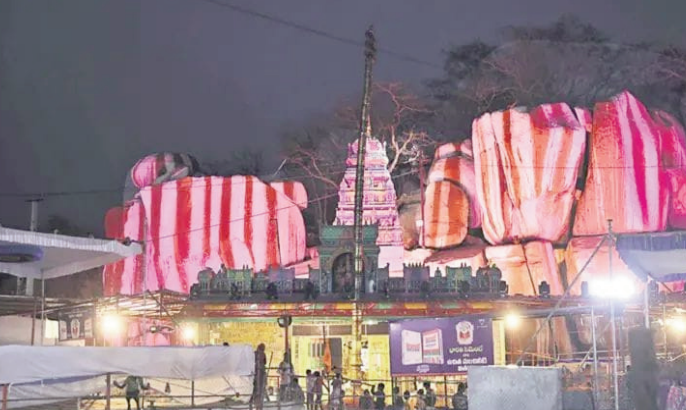
సత్యమేవ జయతే- పాపన్నపేట తెలంగాణలో ప్రసిద్ధ పుణ్యక్షేత్రమైన ఏడుపాయల దుర్గామాత సన్నిధిలో నేటినుంచి చేసి దుర్గమ్మను దర్శించుకొని శివడిక్షలు చేపడతారు. సాయంత్రం