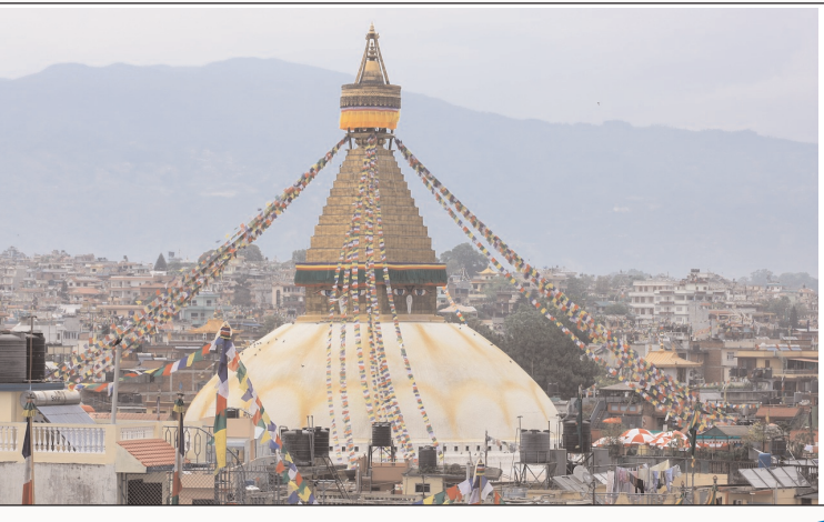
అత్యంత ఎత్తయిన పర్వత శిఖరాలు ఇక్కడ ఉన్నాయి. వీటిని మానవ చేయదుకు అనువుగా రవాణా వసతులు కూడా ఉన్నాయి.