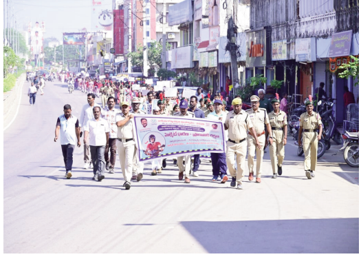
జిల్లా కలెక్టర్ రాహుల్ రాజ్.