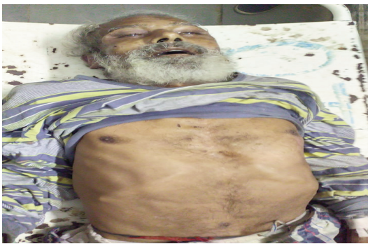
ఉంటున్నారు. అట్టి మగ మనిషి చూచుటకు హిందూవు వలే