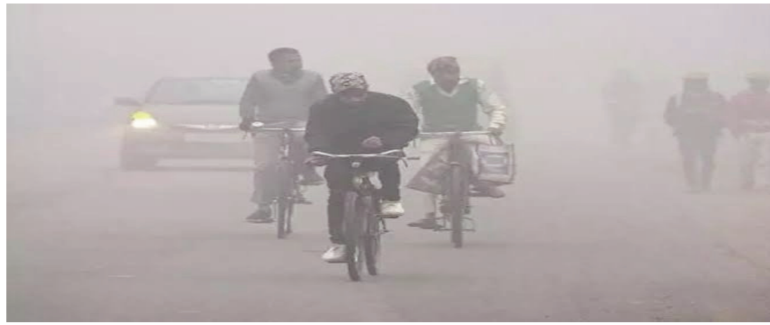
ఉష్ణోగ్రతలు తెలుగు రాష్ట్రాల్లో క్రమంగా పెరుగుతున్నాయి. నేడు తెలంగాణలో పగటివేళ 30 డిగ్రీల సెల్సియస్ ఉంటుంది. ఏపీలో 31 డిగ్రీల సెల్సియస్ ఉంటుంది. రాత్రివేళ తెలంగాణలో 17 డిగ్రీలు, ఏపీలో 19 డిగ్రీల సెల్సియస్ ఉంటుందని ఐఎండీ తెలిపింది. రెండు తెలుగు రాష్ట్రాల్లో ఏజెన్సీ, అడవి ప్రాంతాల్లో చలి ఎక్కువగా ఉంటుంది. పగటివేళ కంటే రాత్రివేళ తేమ బాగా పెరుగుతుందని.. రాత్రిళ్లు చలి నుంచి తగిన జాగ్రత్తలు తీసుకోవాలని ఐఎండీ తెలిపింది. పిల్లలు, ముసలివారు, ఆస్తమా బాధితులు ఎక్కువగా జాగ్రత్తగా ఉండాలని వాతావరణశాఖ అధికారులు తెలిపారు.

సత్యమేవ జయతే - వెదర్ రిపోర్ట్ తెలుగు రాష్ట్రాలకు కోల్డ్ అల్టర్ ఇచ్చారు వాతావరణ శాఖ అధికారులు. నేడు, రేపు ప్రజలు చాలా జాగ్రత్తగా ఉండాలని తెలిపారు. శ్రీలంక కింద ఒక అల్పవీడనం ఏర్పడుతుండటంతో తమిళనాడుకు బలమైన గాలులు వీస్తున్నాయి. దీంతో తమిళనాడు, పుదుచ్చేరి, కేరళ, లక్షద్వీప్ లో తేలికపాటి నుంచి మోస్తరు వర్షాలు కురుస్తాయని ఐఎండీ తెలిపింది. ఏపీ, తెలంగాణకు మాత్రం వర్ష సూచన లేనప్పటికీ చలి విపరీతంగా పెరుగుతుందని అధికారులు తెలిపారు. తగిన జాగ్రత్తలు తీసుకోవాలని.. వీలైనంత వరకు రాత్రిళ్లు ఇళ్ల నుంచి బయటకు రావద్దంటూ సూచించారు. శాటిలైట్ అంచనాల ప్రకారం నేడు తెలుగు రాష్ట్రాల్లో మేఘాలు చాలా తక్కువగా ఉంటాయి. రోజంతా పొడి వాతావరణం ఉంటుంది. కానీ తెలుగు రాష్ట్రాల్లో చలి విపరీతంగా పెరుగుతుంది. ఏపీ కంటే తెలంగాణలో చలి మరింత ఎక్కువగా ఉంటుంది. గాలివేగం బంగాళాఖాతంలో గంటకు 30కిలోమీటర్లుగా ఉంటుంది. ఏపీలో ఇది గంటకు 14కిలోమీటర్లుగా ఉంటుంది. తెలంగాణలో గంటకు 11కిలోమీటర్లు ఉంటుంది. ప్రస్తుతం గాలులన్నీ శ్రీలంకవైపే వీస్తున్నాయి. అక్కడ అల్పవీడనం పెద్దగా ఏర్పడే అవకాశాలు ఉన్నాయని వాతావరణ శాఖ తెలిపింది.