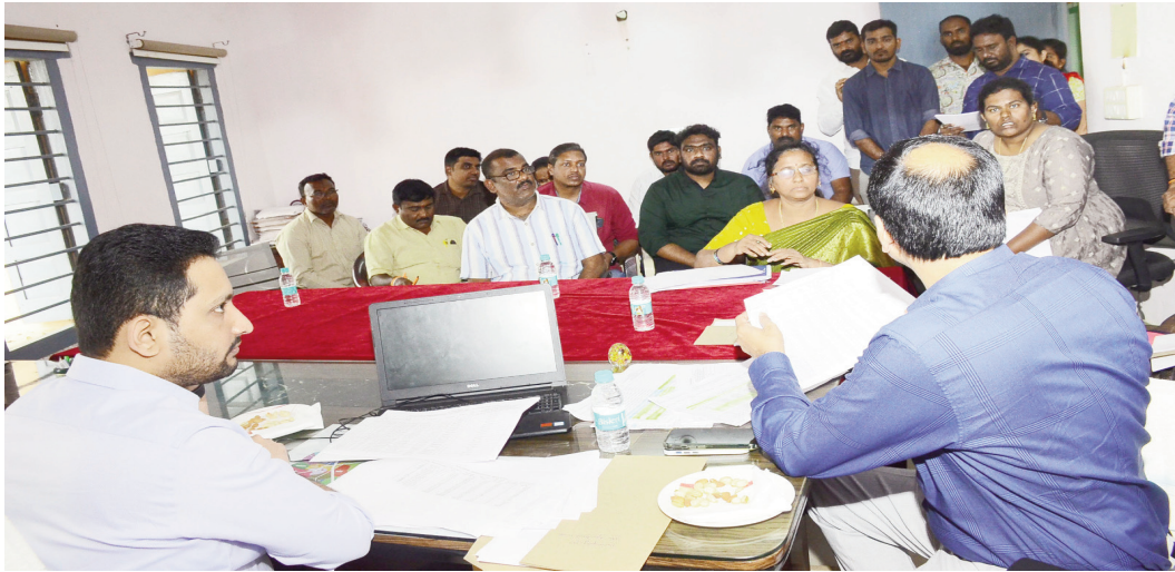
అనంతరం కలెక్టరు మ్యాప్ ద్వారా చిర్రాల, గోధుమకుంట గ్రామాల సర్వే నంబర్ ద్వారా కలెక్టరు పరిశీలించి అవసరమైన సలహాలను, సూచనలను వివరించారు.