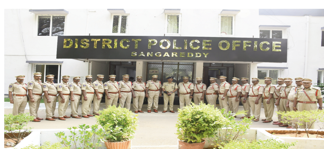
ప్రతి ఒక్కరు ఆరోగ్యం పట్ల శ్రద్ధ వహించి, రోజు వ్యాయామం చేయాలన్నారు. మన ఆరోగ్యంగా ఉన్నప్పుడే ఎలాంటి విధులనైనా సమర్థవంతంగా నిర్వహించగలమని, కుటుంబ సభ్యులతో