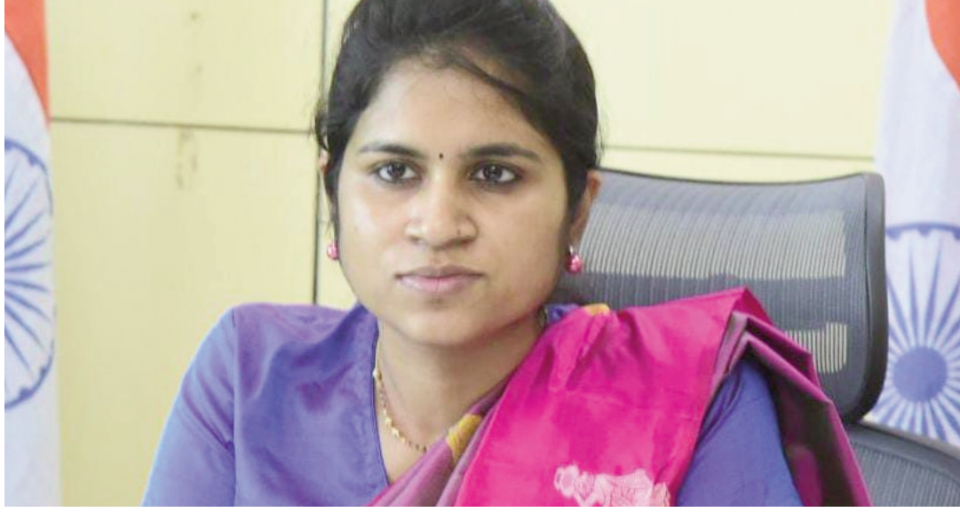
జిల్లా కలెక్టర్ క్రాంతి వల్లారు. జిల్లా ప్రజల సమస్యలకు వేగంగా పరిష్కారం పొందే వినియోగించుకొని ప్రజలు ప్రభుత్వ సేవలను సులభతరంగా అవకాశముందని కలెక్టర్ వివరించారు.